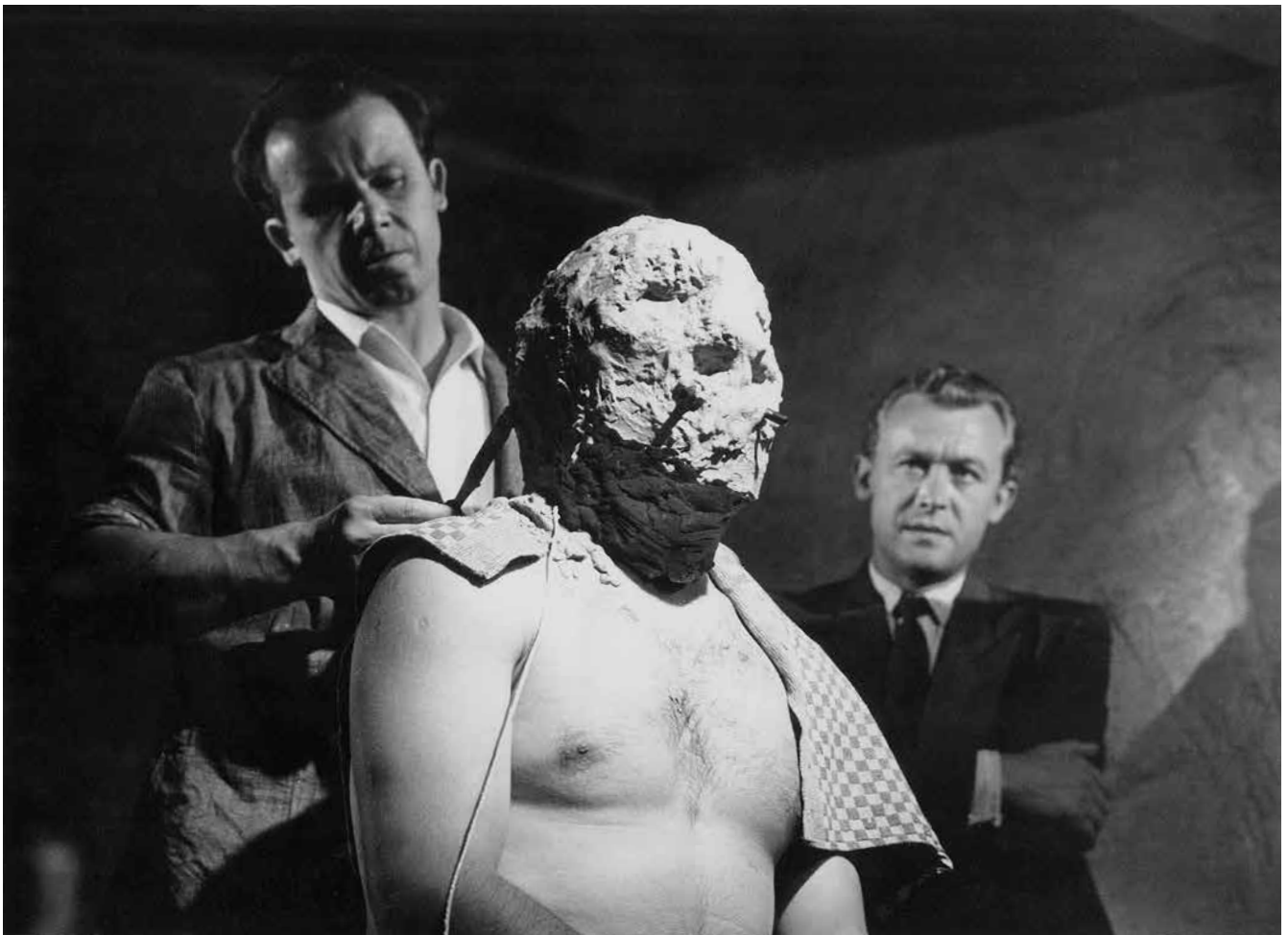
Filmstill aus: Robert Siodmaks Nachts, wenn der Teufel kam, 1957. Akademie der Künste, Berlin, Sammlung Mario Adorf 487