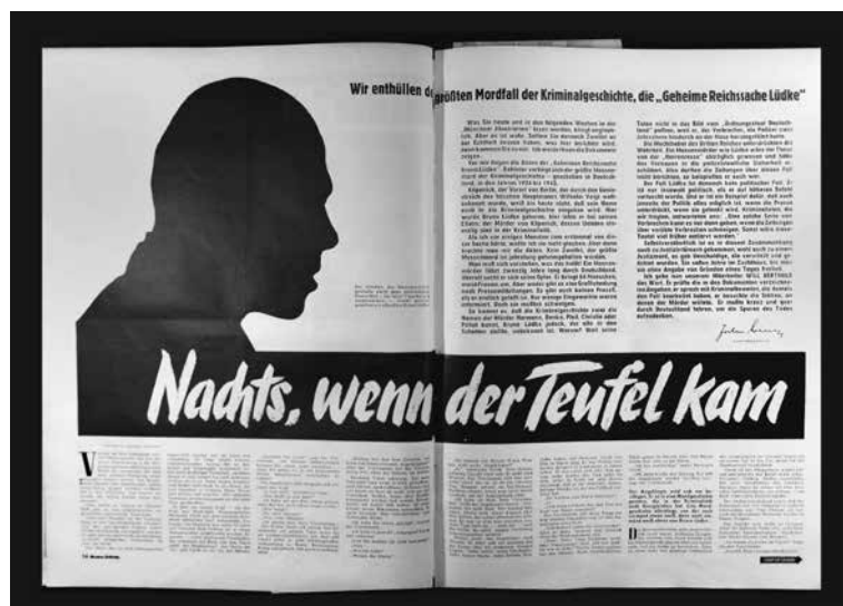
Münchener Illustrierte, 1956